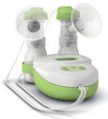
ardo calypso double plus Elektrische Doppel-Milchpumpe