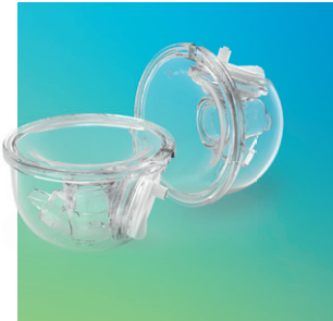
ardo hands-free Tragbares Doppel-Pumpset