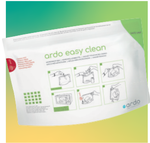
ardo easy clean Beutel für Dampfreinigung