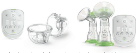
ardo alyssa hands-free oder ardo alyssa double Elektrische Doppel-Milchpumpe

Wenn du während des Abpumpens mobil bleiben und die Hände frei für anderes haben möchtest, wähle z.B. die Ardo Alyssa Hands-Free.