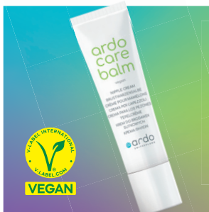
ardo care balm Vegane Brustwarzensalbe