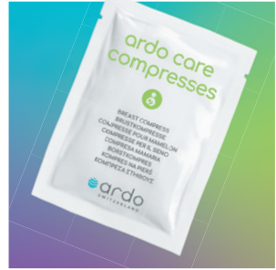
ardo care compresses Brustkompressen