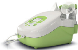
ardo carum Milchpumpe für Kliniken und Vermietung

Relevante Kriterien bei der Wahl einer Milchpumpe: