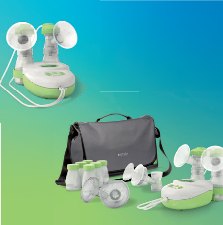
ardo calypso double plus & ardo calypso-to-go Elektrische Doppel-Milchpumpe