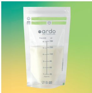
ardo easy store Muttermilchbeutel