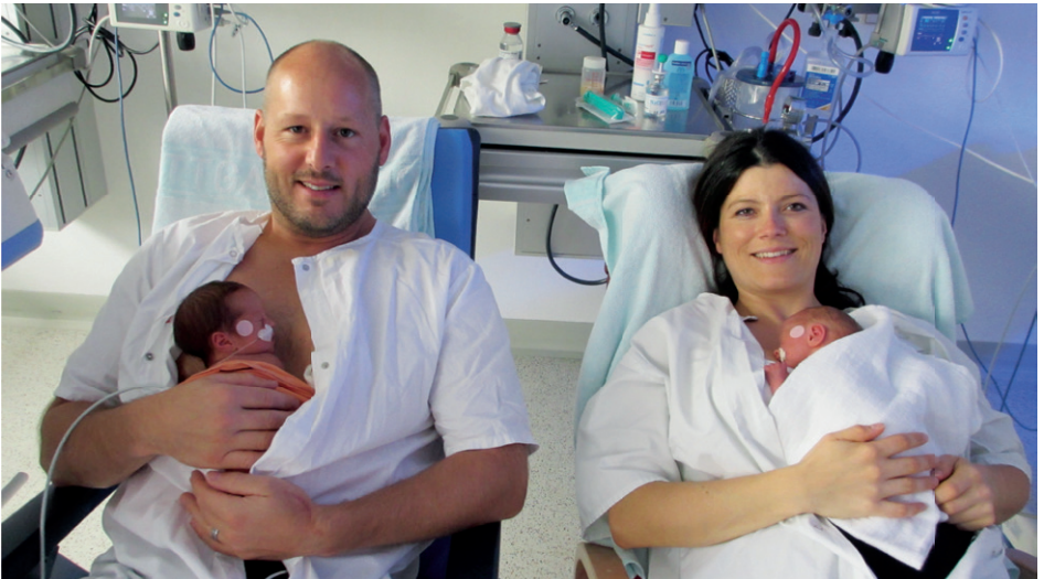
Känguruen – der natürliche und innige Kontakt auch bei Frühgeborenen.

Sollte das Bonding nicht möglich sein (z. B. bei Frühgeborenen), kann die Anfangsphase jederzeit nachgeholt werden. Lege dein Baby für einige Stunden auf die nackte Brust. Auch der Partner kann so den natürlichen und innigen Kontakt genießen.