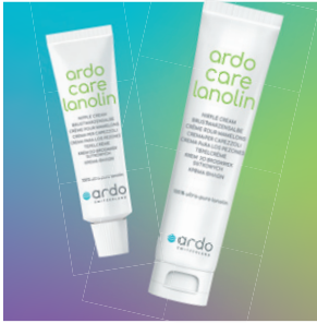
ardo care lanolin Lanolin Brustwarzensalbe