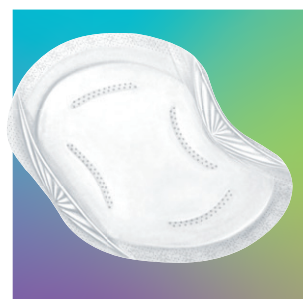
ardo day & night pads Einweg-Stilleinlagen