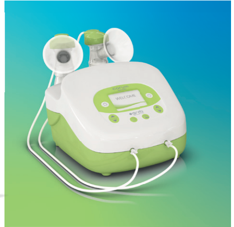
ardo carum Milchpumpe für Kliniken und Vermietung

Unsere Ardo Milchpumpen sind alle mit dem einzeln erhältlichen Ardo Hands-Free Double Pumpset kompatibel. (Einzig bei der Ardo Carum benötigst du zusätzlich zum Ardo Hands-Free Double Pumpset noch einen zweiten Schlauchadapter) Dank dem freihändigen Abpumpen gewinnst du viel Flexibilität und Zeit im Alltag.