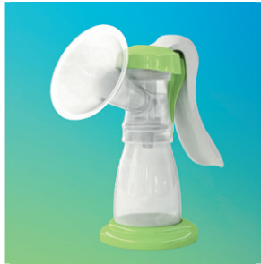
ardo amaryll start Handmilchpumpe