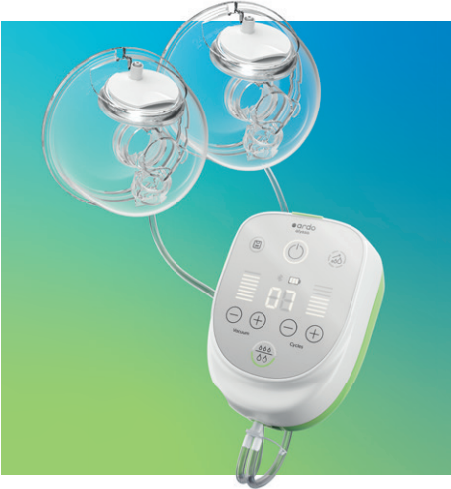
ardo alyssa hands-free Elektrische Doppel-Milchpumpe