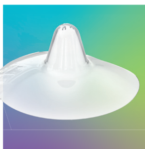
ardo tulips Brusthütchen