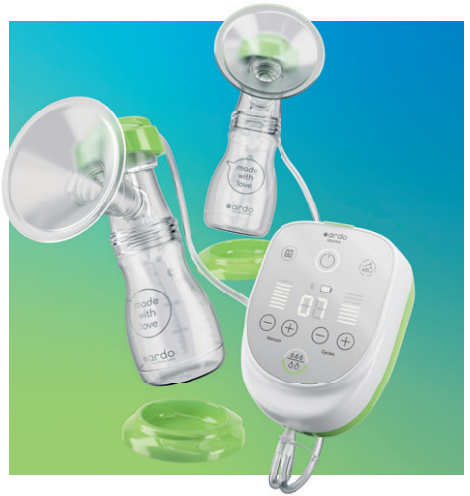
ardo alyssa double Elektrische Doppel-Milchpumpe